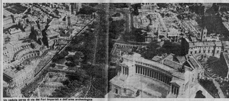
Una veduta aerea di una strada romana e dell'area sottostante.

GLI UFFICI DI CRONACA SONO APERTI AL PUBBLICO DALLE 11 ALLE 13 E DALLE 14 ALLE 17 DEL MATTINO - TELEFONO 4720