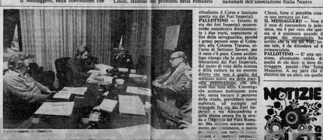
Il sindaco Proietti, nella convinzione che...

L'idea del sindaco Proietti di chiudere via dei Fori Imperiali e smantellarla per riallacciare gli assi di Via dei Fori Imperiali, ha suscitato un acceso dibattito tra i consiglieri comunali e i cittadini.