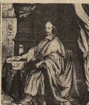
Il cardinale Mazzarino nella sua galleria