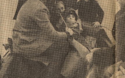
Abbattono un 'Mig 21' dell'aviazione di Damasco - Secondo fonti di Beirut, i velivoli precipitati sarebbero 2 o 3 - Guerrieri palestinesi penetrati nella Galilea