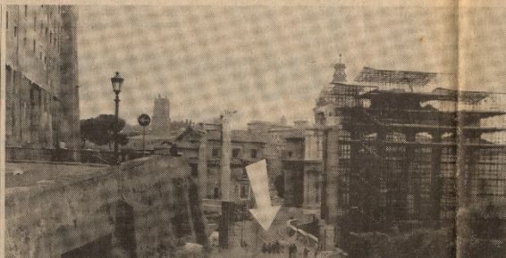
Via dei Fori Romani (indicata dalla freccia) e, nel grafico, le modifiche proposte

Molto può fare il sindaco di Roma per diventare benemerito della cultura. L'impresa che oggi gli suggeriamo avrà il consenso di tutti, non solo di italiani stranieri, e in più ha il pregio di contare soltanto un tempo e di segnare una svolta importante nella storia della città. Dunque: si faccia il piccone, si metta il piccone per distruggere, smantellare, eliminare, questa strada che tra via dei Fori Imperiali e la Constatolatore, corre per un centinaio di metri alle spalle del Campidoglio, separando i due Fori Romani. È una strada che volutamente non ha mai conosciuto, perché da essa, guardando a valle, si poteva vedere il foro di Augusto e il tempio di Saturno. È una strada che, guardando a monte, si poteva vedere il foro di Traiano e il tempio di Antonino e Faustina. È una strada che, guardando a nord, si poteva vedere il foro di Traiano e il tempio di Antonino e Faustina. È una strada che, guardando a sud, si poteva vedere il foro di Traiano e il tempio di Antonino e Faustina.