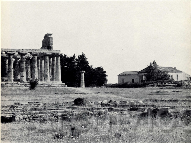
Nelle due foto in alto: Paestum, come Agrigento, come Siracusa, come Ercolano, come Pompei, come Aquilina: zone archeologiche fra le più importanti del mondo sono riservate fra le case. A Paestum si era stabilita una fascia di rispetto di 300 metri: sono stati giudicati eccessivi e ridotti a 150, e l'odiosa disadorna contamina tutto. (Foto Zanca). A destra: come una colata lavica, il disordinato crescere di Agrigento si avvicina a poco a poco ai templi greci. L'incantata atmosfera di questo paesaggio si è ormai svilita: ma si può fare ancora peggio e i tempi futuri forse lo dimostreranno. (Foto Petrioli).