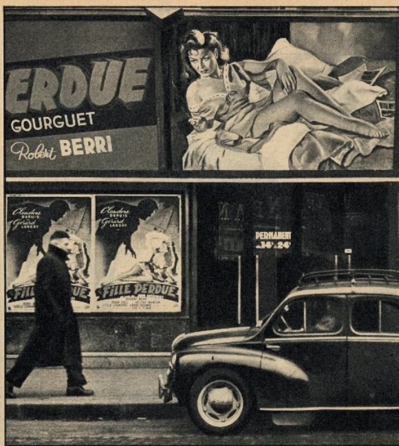
Parigi. Il municipio ha adottato severi provvedimenti contro la pubblicità immorale degli spettacoli. Ecco l'ingresso di un cinema.