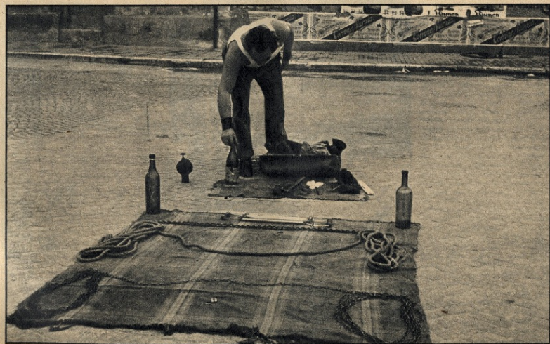
Roma. I ferri del mestiere.

A parte ciò si guardino intorno queste trecento famiglie, e ringrazino chi le ha scaraventate sull'Appia. A occidente, sulla via C. Colombo, sorge un altissimo, insuperabile muraglia di cemento (i due schifosi palazzoni delle cooperative Montecitorio e Palazzo Madama ne sono i primi campioni); a sud la borgata Tor Maricani dilaga; a oriente, al di là dei tratti retti della Via Ardeatina e della Via Appia Antica col nuovo cavalcavia, trasformati in canali infrastrutturali di traffico, si stenderà tutta la