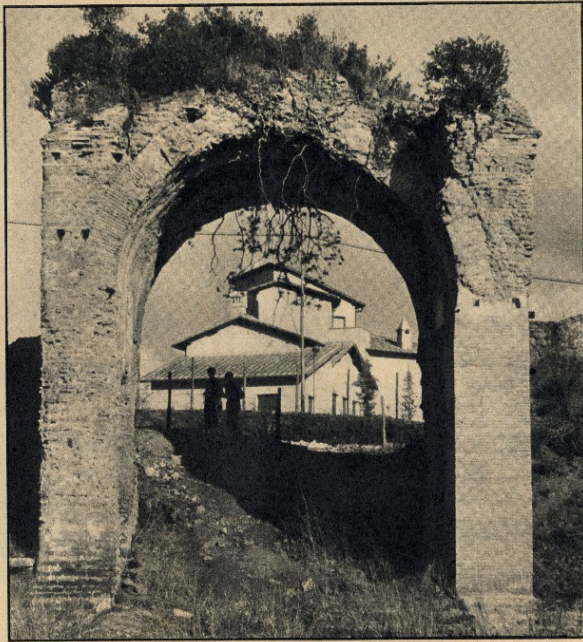
Roma. Via Appia Antica. Un villino con garage.